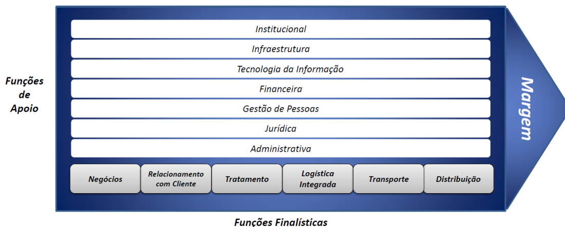
Figura 1 – Cadeia de Valor dos Correios

O trabalho realizado nos Correios identificou sete funções de apoio e seis funções finalísticas, conforme Cadeia de Valor apresentada a seguir: